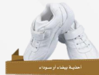
أحذية بيضاء وأسود