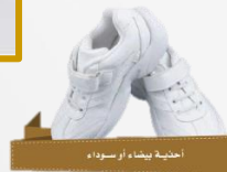
أحذية بيضاء أو سوداء