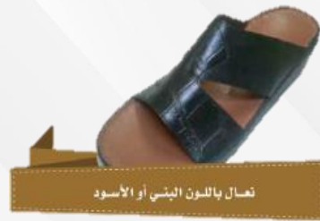
نعال باللون البني أو الأسود